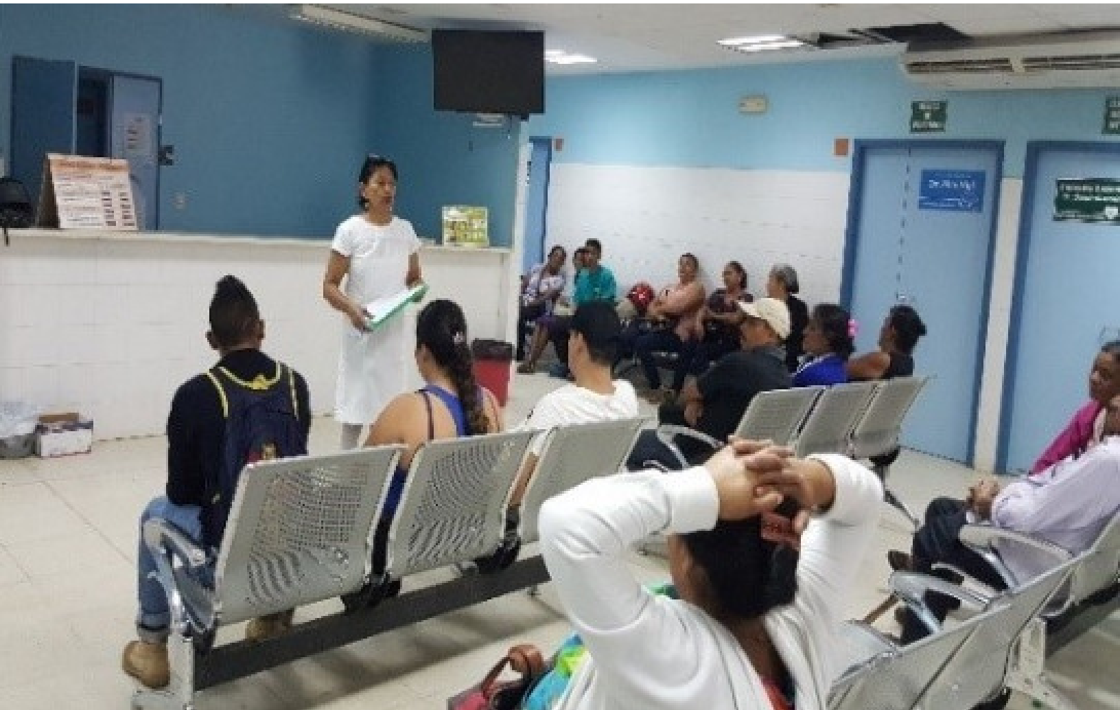
Una enfermera del Hospital General Gabriela Alvarado explica a las usuarias y usuarios de la consulta externa la hoja filtro y solicita de su tiempo y voluntad para aplicarla.