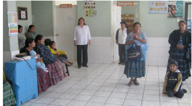
Sala de espera del CAP, lugar donde se implementó la estrategia ProCONE en San Juan Chamelco, Alta Verapaz.

La alta tasa de mortalidad materna en Alta Verapaz (la más alta en todo el país) y otras estadísticas poco satisfactorias, como la alta tasa de analfabetismo -de un 40%- y el alto porcentaje del total de nacimientos que son atendidos en el hogar -1,039 en el 2009-, llevaron al Ministerio de Salud Pública y Asistencia Social (MSPAS) a implementar la estrategia de Promoción y Cuidados Obstétricos y Neonatales Esenciales (ProCONE) en el municipio, con apoyo del proyecto USAID|Mejoramiento de la Atención en Salud. Esta estrategia se enfoca en mejorar la calidad en la prestación de servicios prenatales, del parto, posparto y neonato a través de la aplicación de las normas de atención en los Centros y Puestos de Salud de Atención Permanentes (CAP), Centros de Atención Integrada Materno Infantil (CAIMI) y Hospitales. La metodología utilizada para el mejoramiento