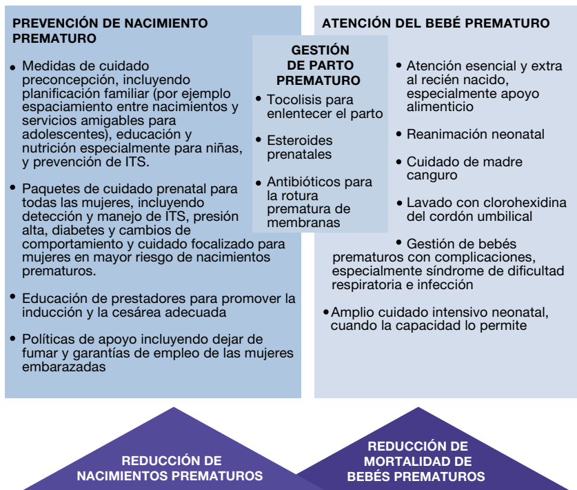
Figura 3: Enfoques para prevenir los nacimientos prematuros y reducir las muertes de bebés prematuros

Para la investigación de la prevención del nacimiento prematuro, el mayor énfasis debe estar en el aprendizaje descriptivo y de descubrimiento, a fin de entender qué puede hacerse para prevenir el nacimiento prematuro en diversos contextos. Si bien se requiere de una inversión a largo plazo, los riesgos para los nacimientos prematuros y las soluciones necesarias para reducir estos riesgos durante cada etapa del continuo de la salud reproductiva, materna, neonatal e infantil, son cada vez más evidentes (Capítulos 3-5). Sin embargo, para muchos de estos riesgos tales como infecciones del tracto genital, no tenemos todavía soluciones eficaces de programa para la prevención.