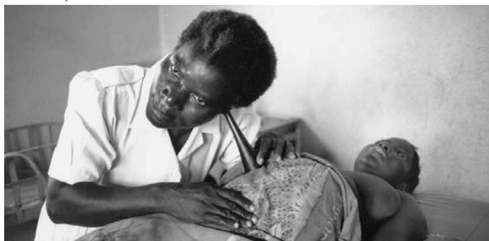
Una embarazada recibe atención prenatal en Malawi.