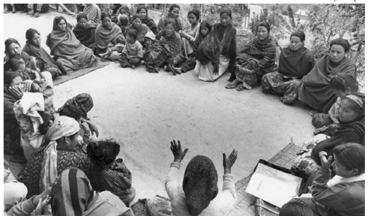
Miembros de una comunidad en Nepal asisten a una reunión sobre la salud del recién nacido.