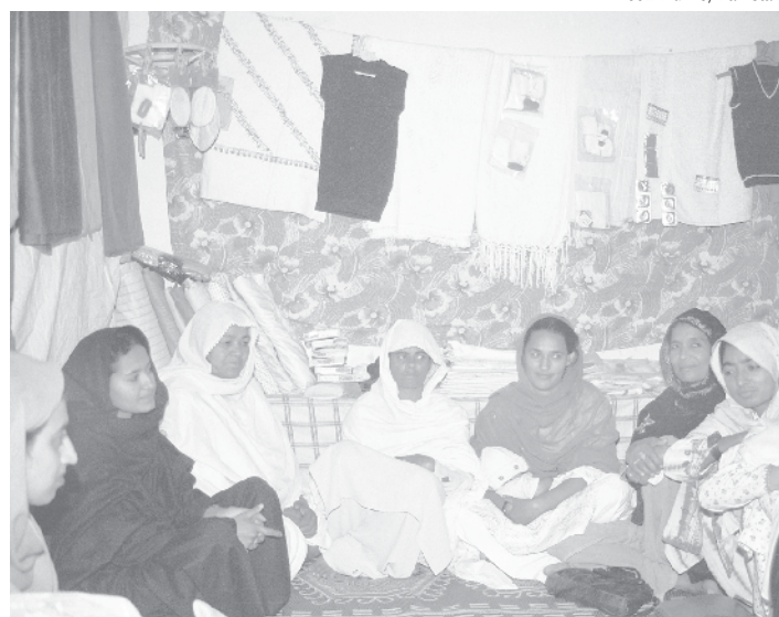
Tenderas y trabajadoras de salud del Distrito de Haripur en Pakistán asisten a una sesión de capacitación sobre maletines de parto seguro.