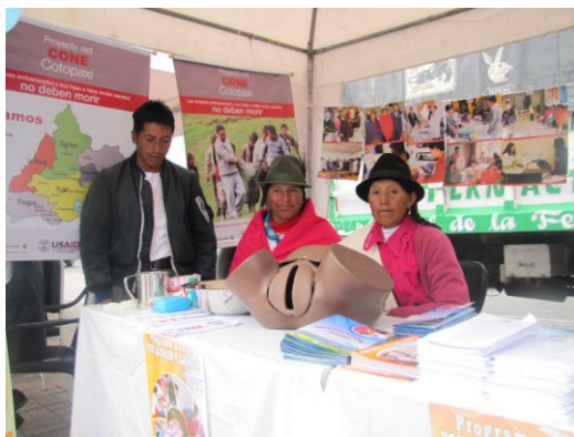
Partero y parteras capacitados de Guangaje realizan demostración de habilidades.

Durante la feria, las distintas Áreas de Salud de la provincia ubicaron stands promocionales de los componentes del Proyecto Red CONE y las parteras capacitadas realizaron demostraciones de las prácticas que ejecutan durante las visitas domiciliarias a las madres y recién nacidos de las comunidades, otro de los temas que se tratan de manera prioritaria dentro del programa radial.