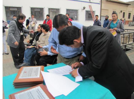
Firma de convenios Dirección Provincial de Salud de Cotopaxi y emisoras.

Con ocasión del primer aniversario del programa radial, el viernes 18 de enero de 2013 se realizó en la ciudad de Latacunga la feria Por la Salud y la Vida, en la cual la DIPSC firmó convenios con las emisoras que difunden el programa, con la finalidad de garantizar su sostenibilidad, a la vez que se entregaron placas de reconocimiento a las emisoras e instituciones responsables del desarrollo de esta estrategia participativa.