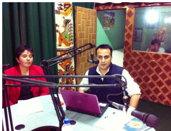
Realización del programa Por la Salud y la Vida

A partir de entonces, se fueron sumando voluntariamente otras emisoras de alcance local como Radio Municipal Sigchos, Radio Runatacuyay, Radio San Luis de Pambil, Radio Ecos del Pueblo y Radio Stereo Saquisilí. Esta red de emisoras asume su responsabilidad de apoyar en la prevención de un problema grande en una de las provincias con mayores índices de mortalidad materna y neonatal en el país. En el año 2010, 7 mujeres perdieron la vida al momento del parto, y 52 niños murieron antes de cumplir su primer mes de vida.