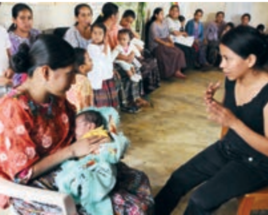
▲ Un trabajador de la salud habla con una mujer que amamanta a su hija en un centro de salud de la municipalidad de Cobán, Guatemala.

Afortunadamente para quienes toman las decisiones, las encuestas por hogares proporcionan las pruebas cruciales. Muchísimas personas responden estas