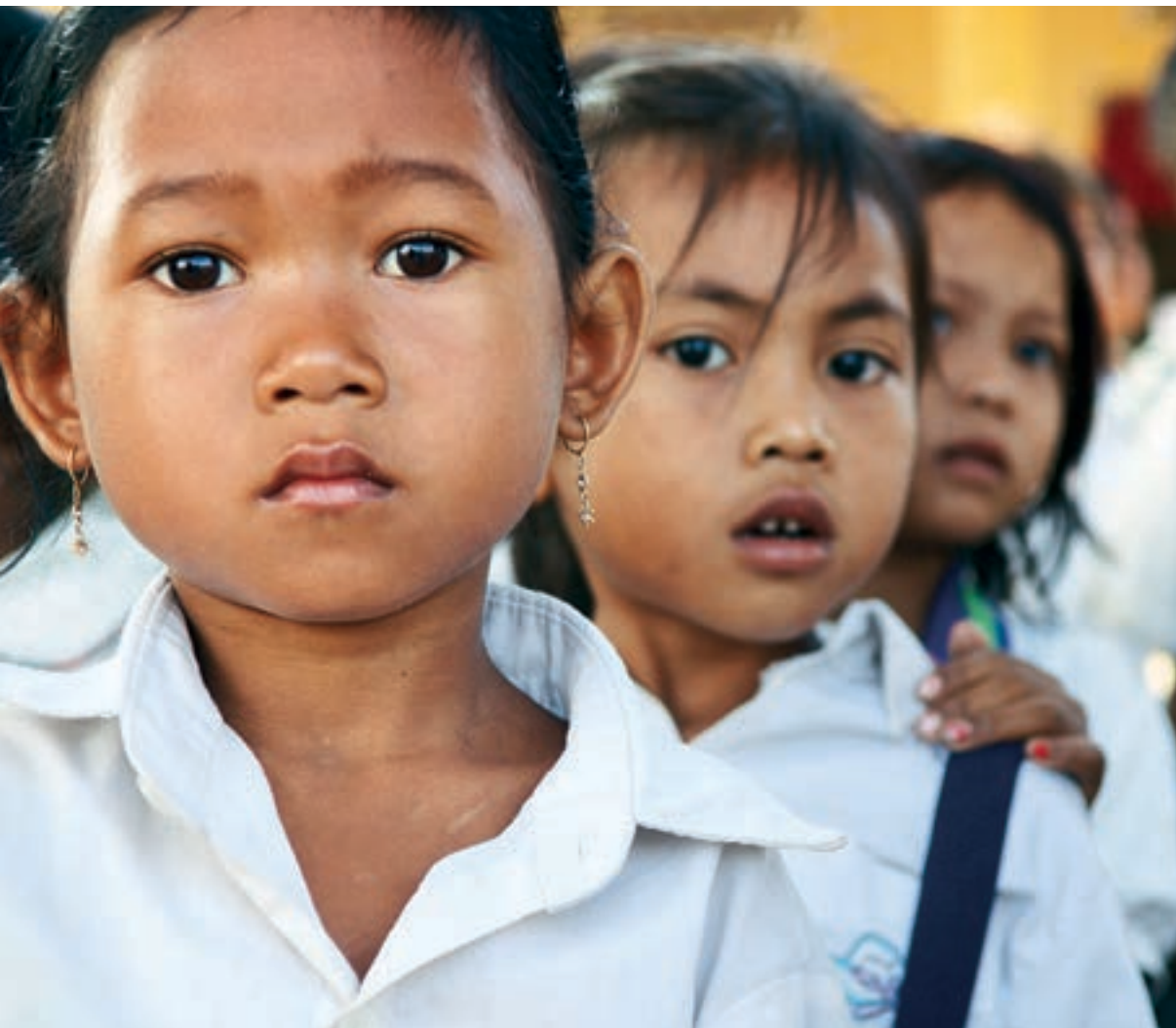
▲ Unas niñas hacen fila en una escuela de Camboya.