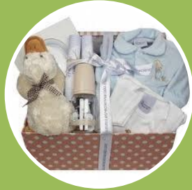
CANASTILLA DE RECIEN NACIDO