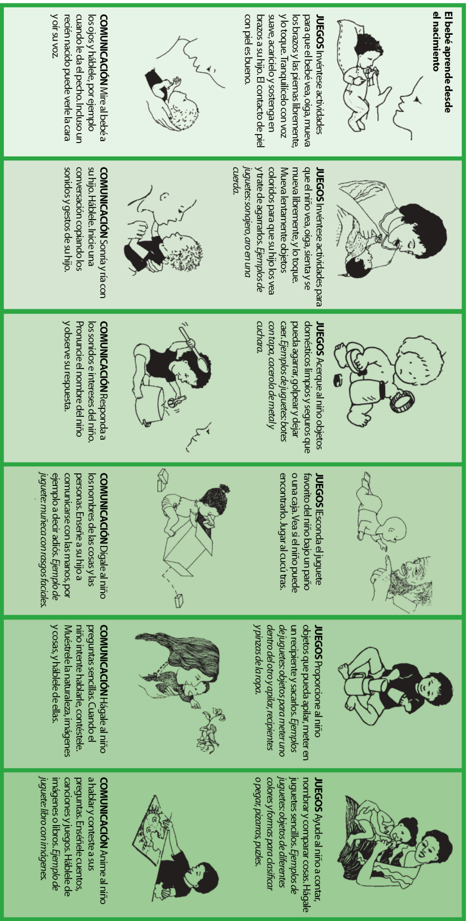
Recuadro 5. Consejos para fomentar el desarrollo del niño (12)