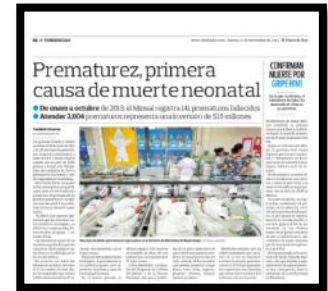
Nota de prensa impresa El Diario de Hoy 21 de Noviembre 2013