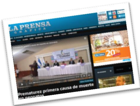
Reportaje La Prensa Gráfica - Multimedia 20 de Noviembre 2013