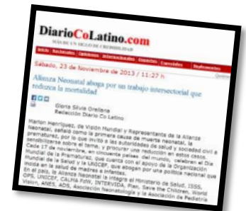
Nota de prensa digital Diario CoLatino 23 de Noviembre 2013

Los medios de comunicación, también se sumaron al esfuerzo de sensibilización de la población en la Semana de la Prevención y Atención de la Prematurez, en donde se publicaron notas de prensa, reportajes y entrevistas en radio y canales de televisión acerca de la primera causa de muerte en niños menores de 28 días. Medios como La Prensa Gráfica, El Diario de Hoy, Periódico Digital Equilibrium, Diario CoLatino y diferentes canales de televisión, a través de sus tele-revistas matutinas como Viva la mañana, brindaron espacio para hablar sobre el tema.