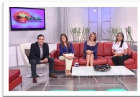
Entrevista Programa Viva la mañana – TCS 20 de Noviembre 2013