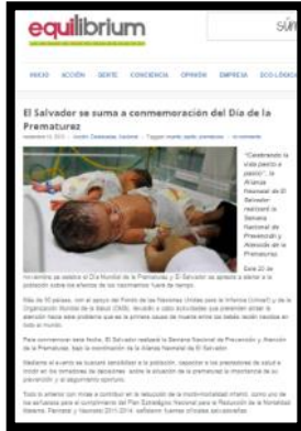
Nota de prensa digital Periódico Equilibrium 19 de Noviembre 2013